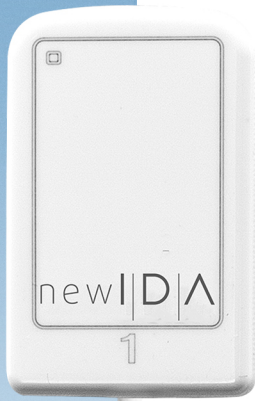
Tamaño 1 área activa: 20 x 30 mm